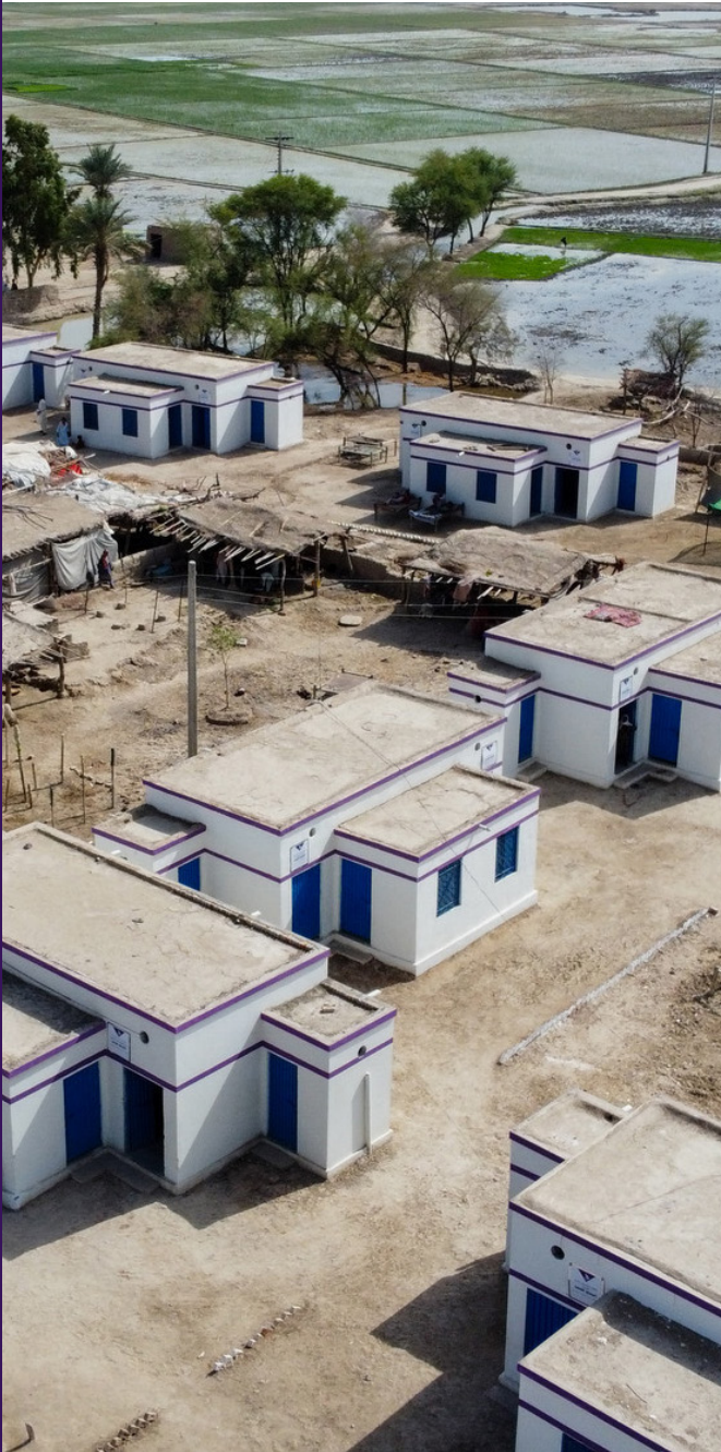
صورة: أولى المنازل التي دسناها في قرية غلام.

أكملت هيومان أيبيل المرحلة الأولى من بناء المنازل الجديدة في قرية غلام حسين شانديو لأولئك الذين فقدوا منازلهم في فيضانات عام 2022. تأتي هذه المنازل لتكون أكثر قدرة على مقاومة الفيضانات ويحتوي الواحد منها على مراحيض ومرآح ومصابيح كهربائية ملحقة به. لقد بنينا 28 منها وسلمناها للعائلات بالفعل، على أمل أن تتمكن من بناء أكثر من 500 منزل من هذه المنازل في الأشهر المقبلة.